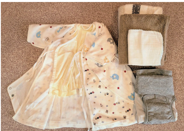
入院時あずかる一式

※お産セットは入院時にお渡ししております。お産時に使用する清潔なシーツ類、ナプキン(M、L)などが入ってます